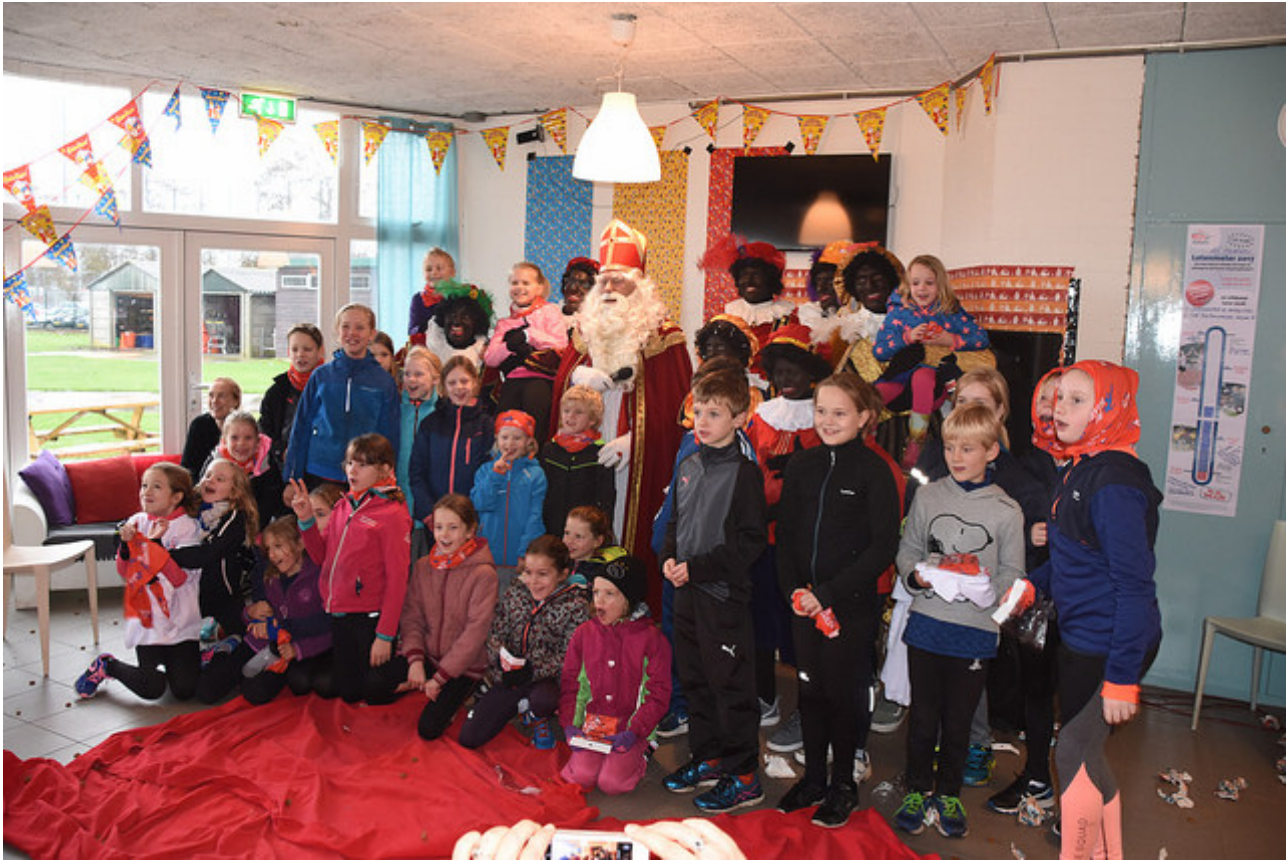
Sinterklaasfeest voor de pupillen 3 december 2017