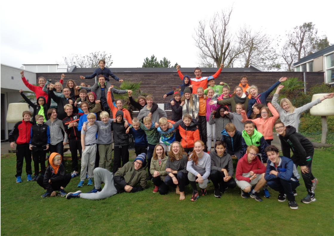
CD junioren kamp in de herfstvakantie op 21 en 22 oktober samen met KAV Holland