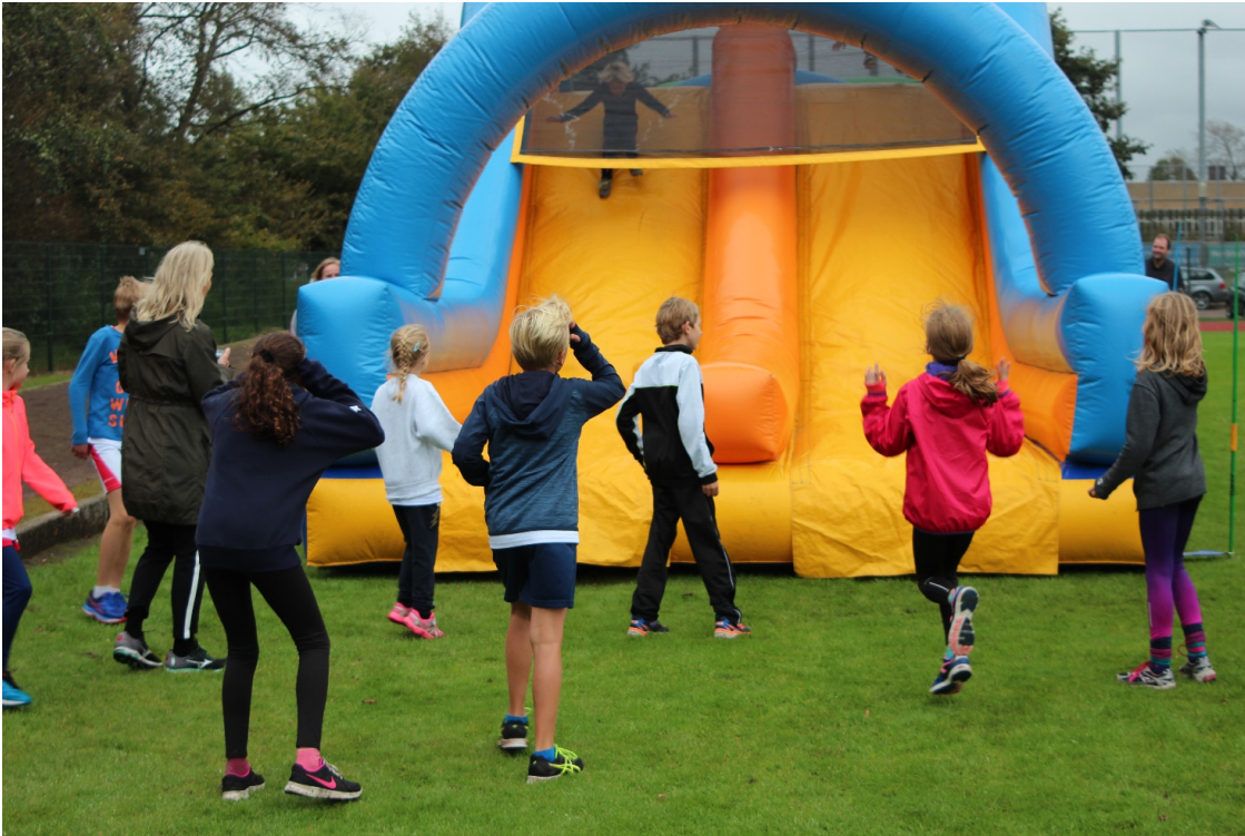
Stormbaan tijdens de Onderlinge op 7 oktober 2017