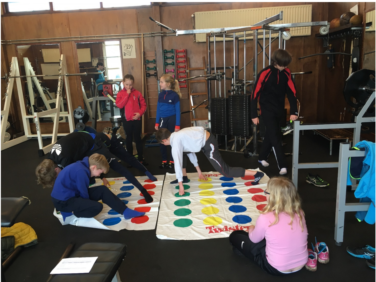
Spelletjesmiddag voor de pupillen na de laatste wintertraining op 19 maart 2017

CD junioren naar Bounz op 25 maart 2017 (Foto ontbreekt)